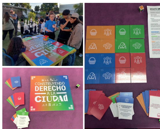
Imagen 1: Juego Desafío Urbano