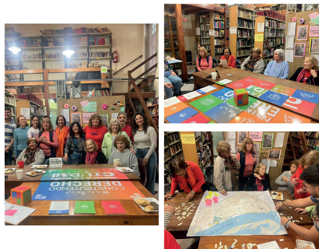
Imagen 3: Situación de juego en taller La Ciudad en juego Biblioteca Popular La Florida

Hay un protagonismo de las emociones y sensibilidades compartidas, las memorias y relatos identitarios. Las discusiones sobre política urbana se desarrollan de manera situada, predominando la escala barrial. Aquí combinamos el juego con la elaboración de una cartografía colaborativa sobre el Derecho a la ciudad en el barrio que trabajamos. Constatamos una retroalimentación y afirmación de los sentidos emergentes en el juego que luego se plasman en el mapa, lo que nos permitió también ensayar triangulación metodológica con otros dispositivos como la cartografía (Imagen 3).