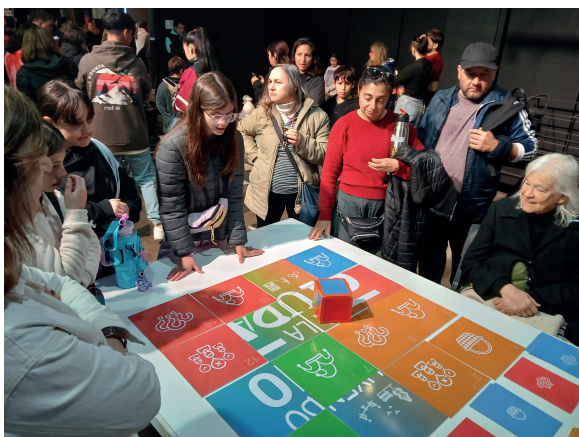
Imagen 2: Situación de juego con grupo espontáneo